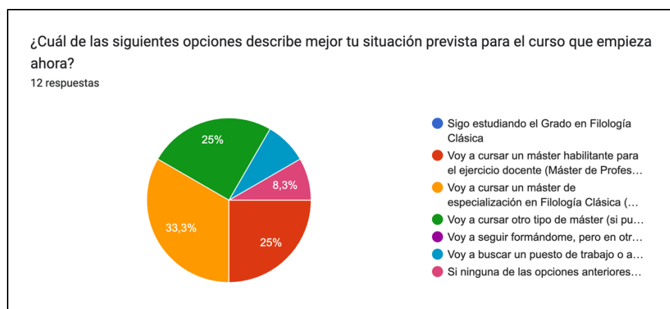
Figura: Respuestas a la encuestas de seguimiento (año 1) de egresados en el curso 2024-25.

Las respuestas obtenidas hasta el momento aportan datos iniciales para el seguimiento, recogidos en el siguiente gráfico: